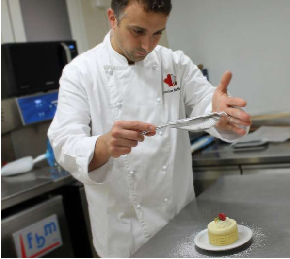
Serata aperta a famigliari, amici ed ospiti Conferma gradita